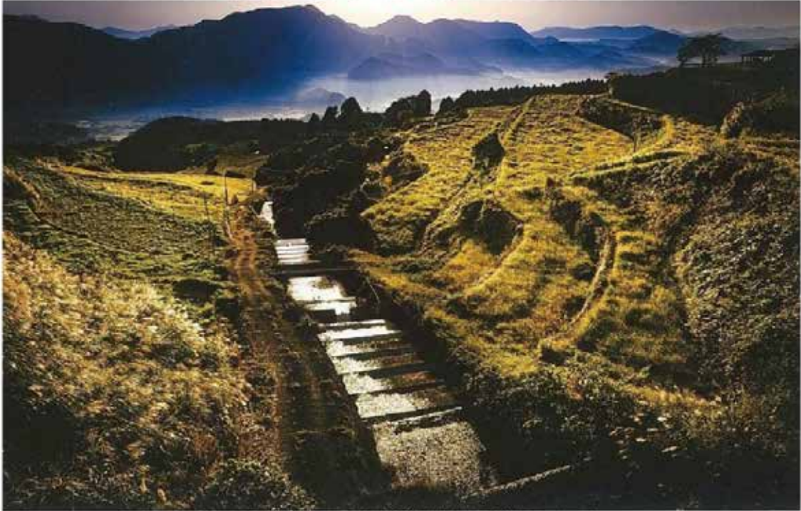
疏水部門2022最優秀賞『岳の團田と朝霧』