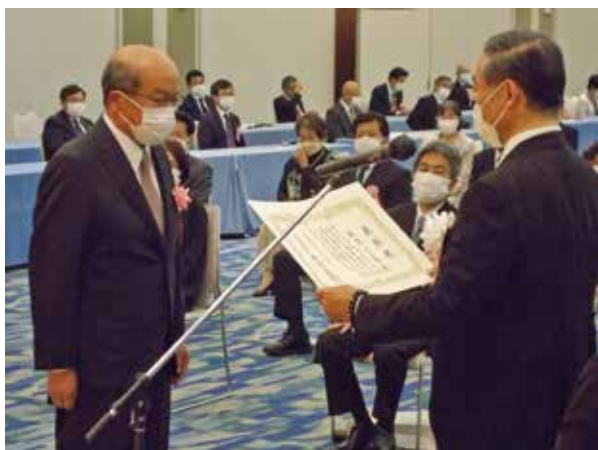
飯泉徳島県知事から表彰状授与

これまでのたゆまぬご努力に敬意を表し、このたびの受賞を心よりお慶び申し上げますとともに、今後益々のご活躍を祈念申し上げます。