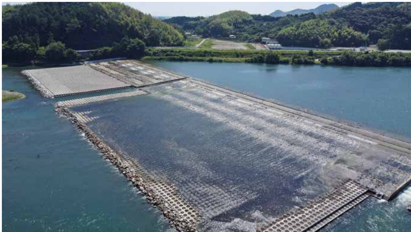
那賀川・南岸堰（阿南市）