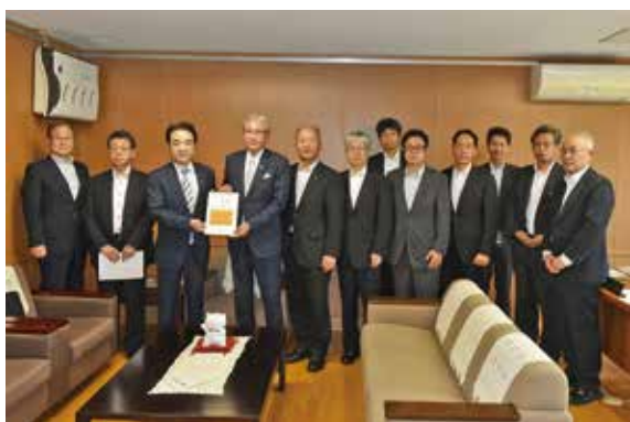
古屋自民政調会長代行