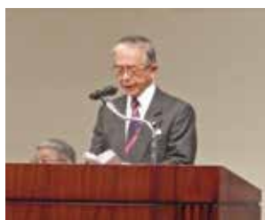
金子農林水産大臣