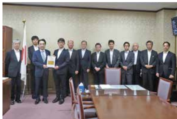
高村財務大臣政務官