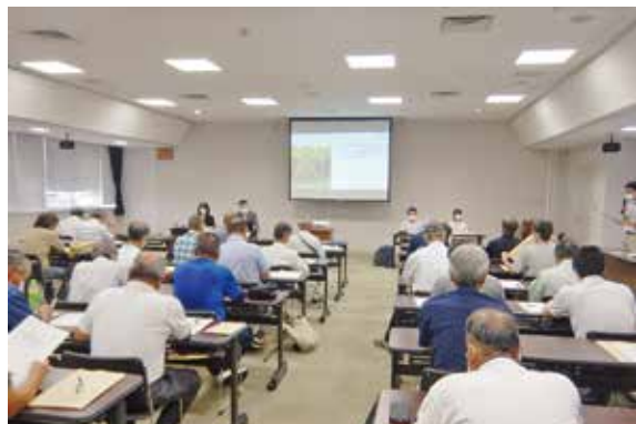
説明会の様子（南部総合県民局（阿南庁舎））

徳島県及び関係市町村、活動組織等より180名が参加し、講演後には制度内容等についての活発な質疑応答がありました。