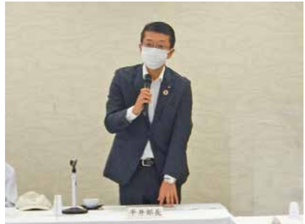
平井部長来賓挨拶