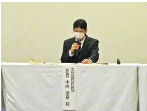
中西課長情勢報告