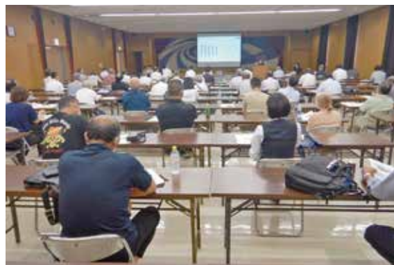
説明会の様子（J A会館）