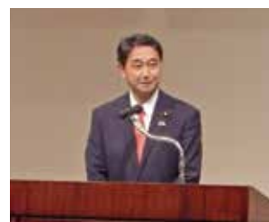
全国水土里ネット会長会議顧問 進藤参議院議員