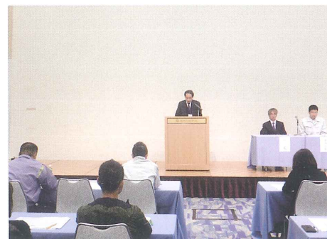
岸本課長補佐様来賓挨拶

日時／平成 31 年 3 月 18 日(月) 午後 2 時～ 場所／徳島市 徳島グランヴィリオホテル