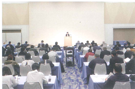
複式簿記研修会の様子