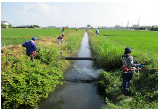
二香種の確保(ツルの餌として)