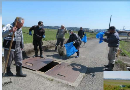
ポンプ送水準備作業 (田野芝生土地改良区)