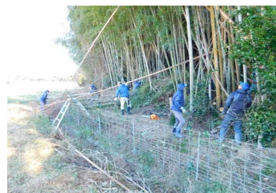
防護柵適正管理作業 (田野芝生土地改良区)