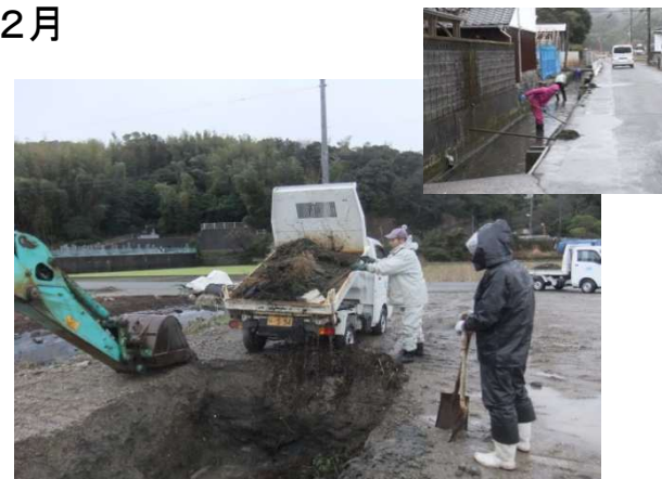
芝生町内清掃活動 (芝生町協議会)