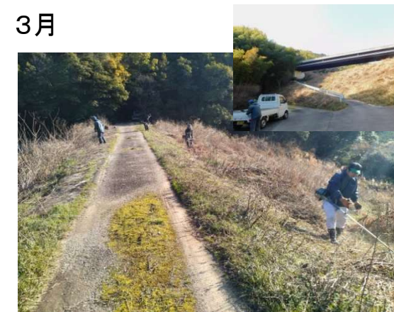
ため池草刈り作業 (田野町ため池水利組合)