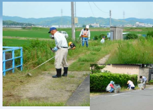
勢合町内清掃活動 (勢合実行組・田野町協議会)