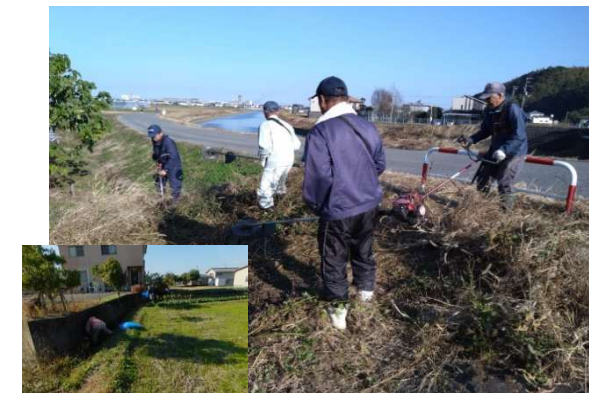
向ノ原清掃活動 (向ノ原実行組・田野町協議会)