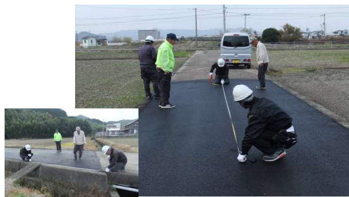
西浦農道舗装竣工 (西浦土地改良組合)