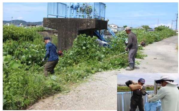
樋門草刈り・補修作業 (田野芝生土地改良区)