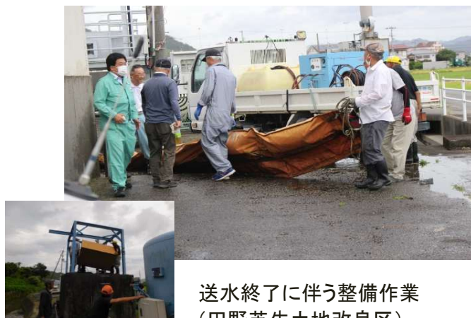
送水終了に伴う整備作業 (田野芝生土地改良区)