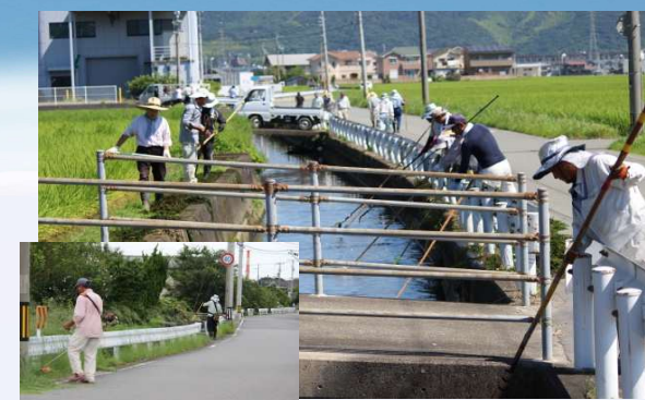
上湯藻刈り作業 (上湯水利組合)