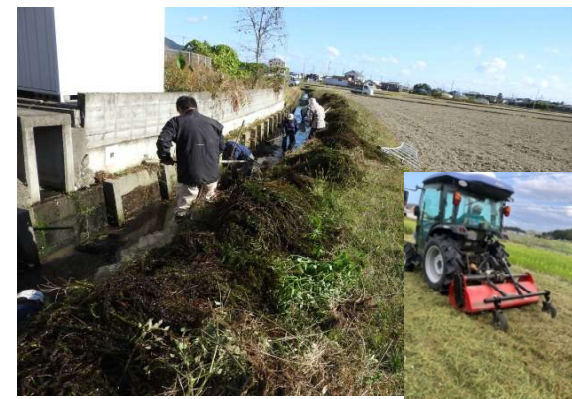
開水路泥上げ草刈り作業 (西浦土地改良組合)