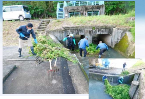
天王谷ポンプ取入口水路清掃作業 (田野芝生土地改良区)