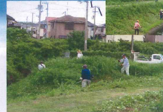
区有地周辺草刈り作業 (田野芝生土地改良区)