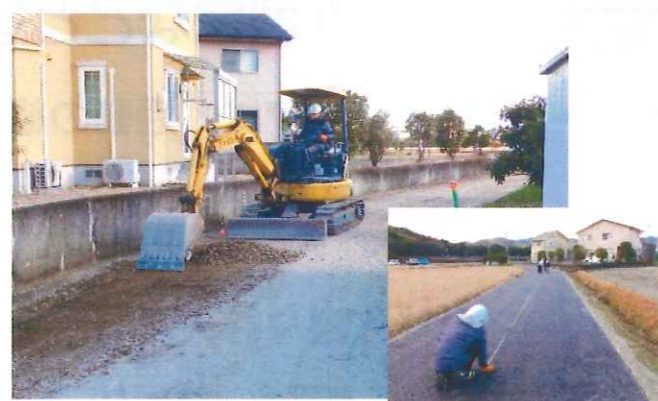
田野町高田農道補修工事 (田野芝生土地改良区)