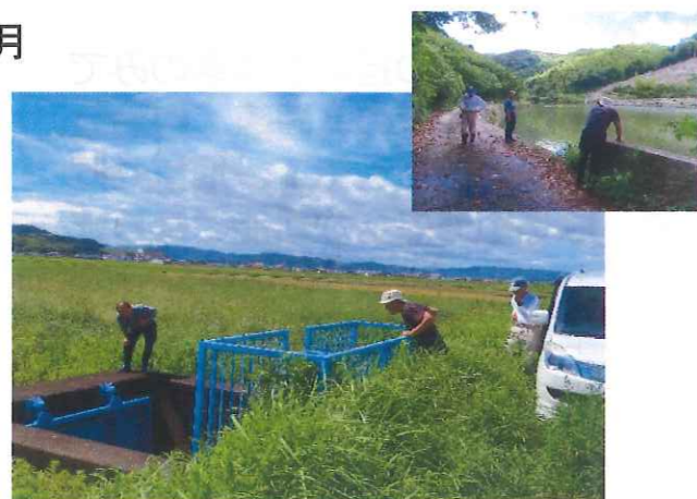
台風10号後の点検活動 (田野芝生土地改良区)