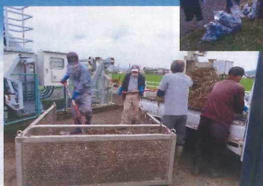
用排水ポンプ場ゴミ処理作業 (田野芝生土地改良区)