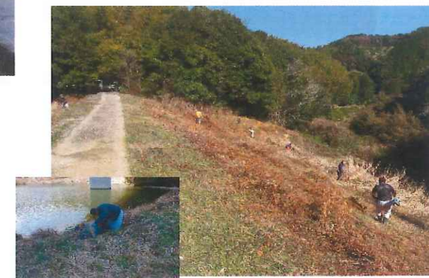
ため池草刈り作業 (田野町ため池水利組合)