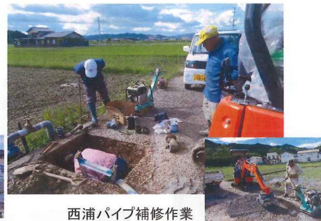
西浦パイプ補修作業 (西浦土地改良組合)