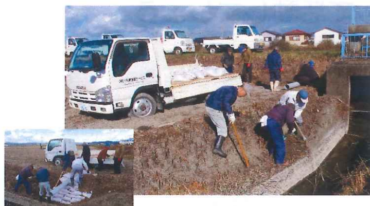
田野町赤石中土手補修 (田野芝生土地改良区)