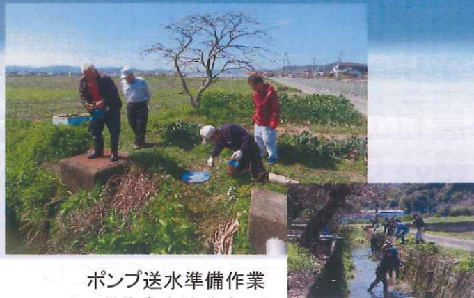
ポンプ送水準備作業 (田野芝生土地改良区)