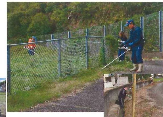
向ノ原清掃活動 (向ノ原実行組・田野町協議会)