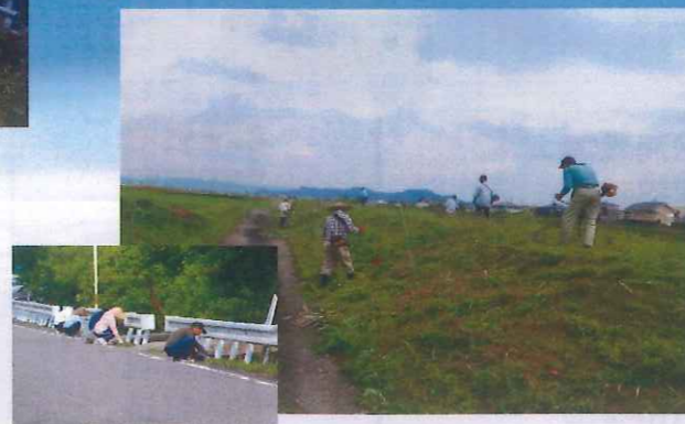
勢合町内清掃活動 (勢合実行組・田野町協議会)