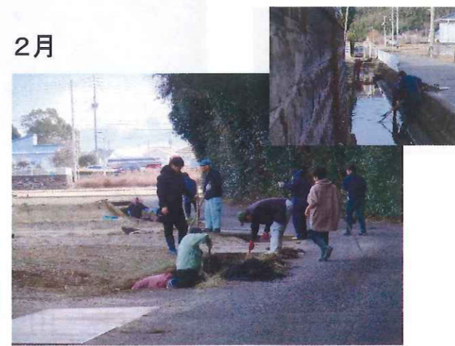
芝生町内清掃活動 (芝生町協議会)