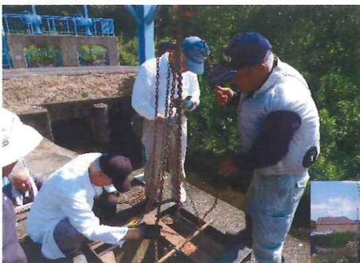
送水終了に伴う整備作業 (田野芝生土地改良区)